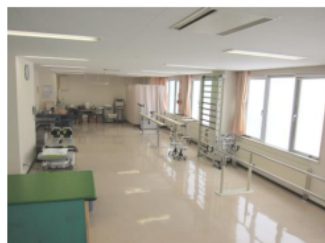
リハビリテーション室（新棟一階）

入院中の患者様が安全・安楽に生活を送れるよう、リハビリテーション室に限定せず病室やベッド上においても、機能訓練、日常生活の動作訓練、レクリエーション活動と、幅広く活動しています。退院する際には、ご自宅の生活環境を整えるお手伝いも行っております。