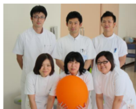
リハビリテーションスタッフ一同