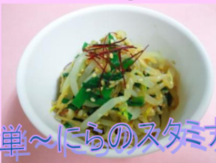
簡単～にらのスタミナ和え～