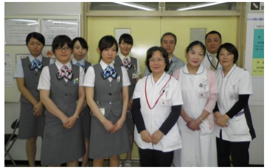
<外来・受付スタッフ>

その他札幌市検診・特定健康検査、一般検査、企業検診等も行っております。スタッフ一同、患者さま・ご家族さまが安心して来院し治療が受けられますよう努力してまいります。