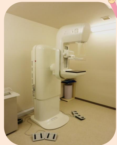
乳房撮影専用X線診断装置(マンモグラフィ)

乳房にしこりやくぼみなど症状がある場合は、乳がんの早期発見の為にも早めに受診しましょう。